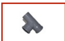
TÊ SIMPLES SB A 87° 30' C/ ORING